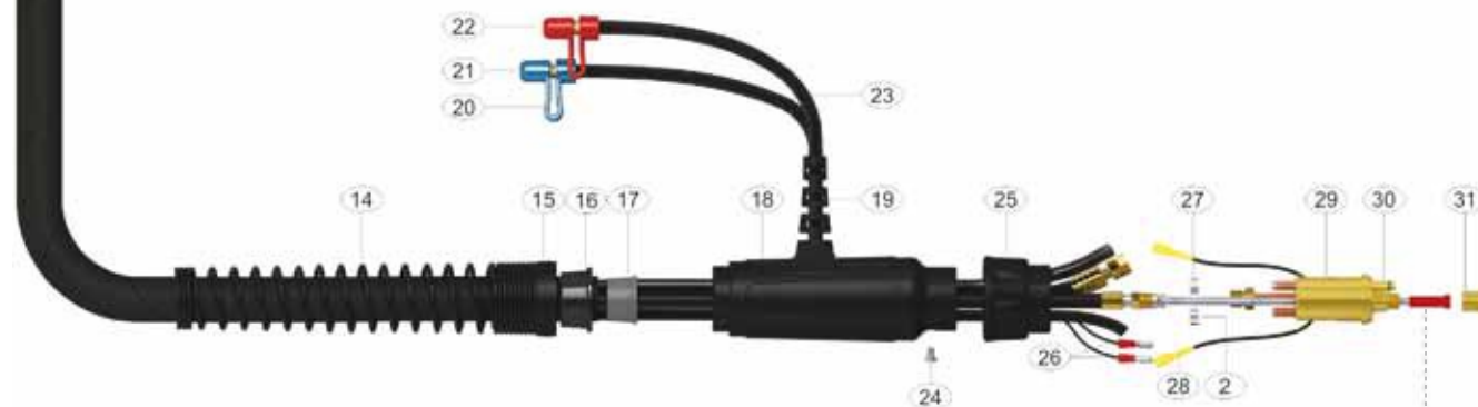
Bovdeny strana 39-43